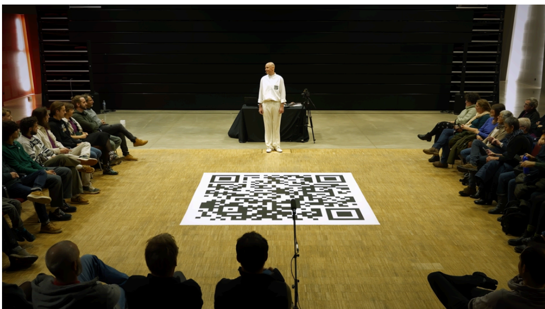
Photo du dispositif scénique